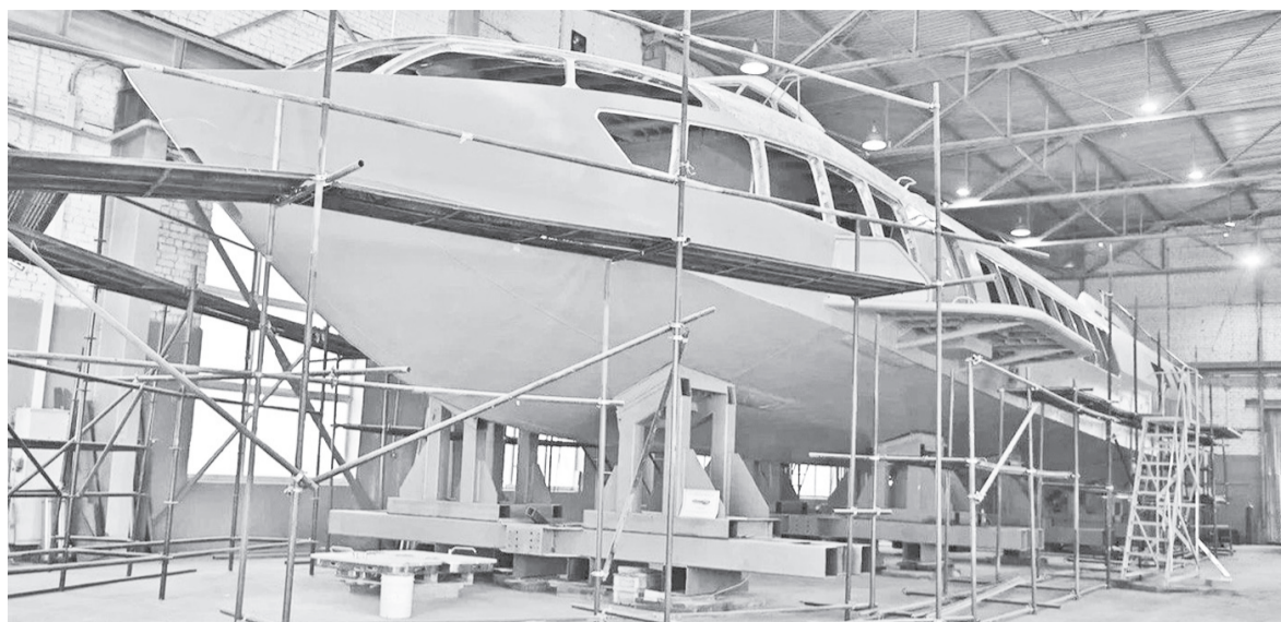
Центральным конструкторским бюро по судам на подводных крыльях имени Р. Е. Алексеева построено более 5000 пассажирских судов, катеров, экранопланов и транспортных платформ, эксплуатирующихся в 35 странах мира.